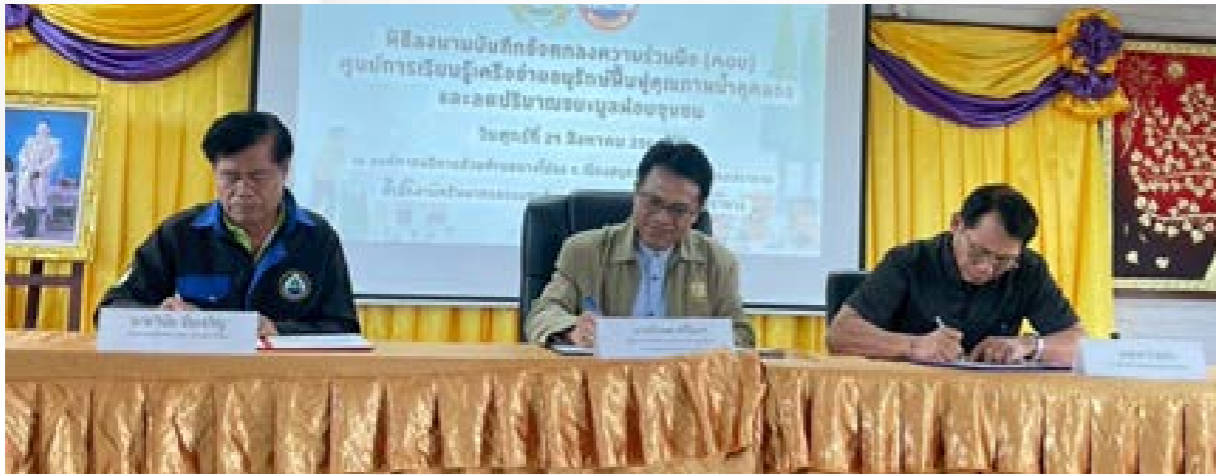
วันที่ 29 สิงหาคม 2568 จัดกิจกรรมลงนามบันทึกข้อตกลงเปิดศูนย์การเรียนรู้เครือข่าย อนุรักษ์ฟื้นฟูคุณภาพน้ำคลองและลดปริมาณขยะมูลฝอยชุมชน

ณ ห้องประชุมองค์การบริหารส่วนตำบลบางโปรง โดยมีกิจกรรมทำน้ำหมักชีวภาพ ปั้น EM ball และเยี่ยมชมศูนย์การเรียนรู้ ณ ที่ทำการประธานเครือข่าย ทสม. ตำบลบางโปรง โดยการเปิดศูนย์การเรียนรู้ มีวัตถุประสงค์เพื่อเป็นแหล่งเผยแพร่ข้อมูลข่าวสารพร้อมทั้งเป็นแหล่งเรียนรู้ด้านการอนุรักษ์ฟื้นฟูคุณภาพน้ำคลองและลดปริมาณขยะมูลฝอยชุมชน ให้กับเครือข่าย ทสม. ในจังหวัดสมุทรปราการ และประชาชนทั่วไปที่สนใจ อยู่ระหว่างดำเนินการ