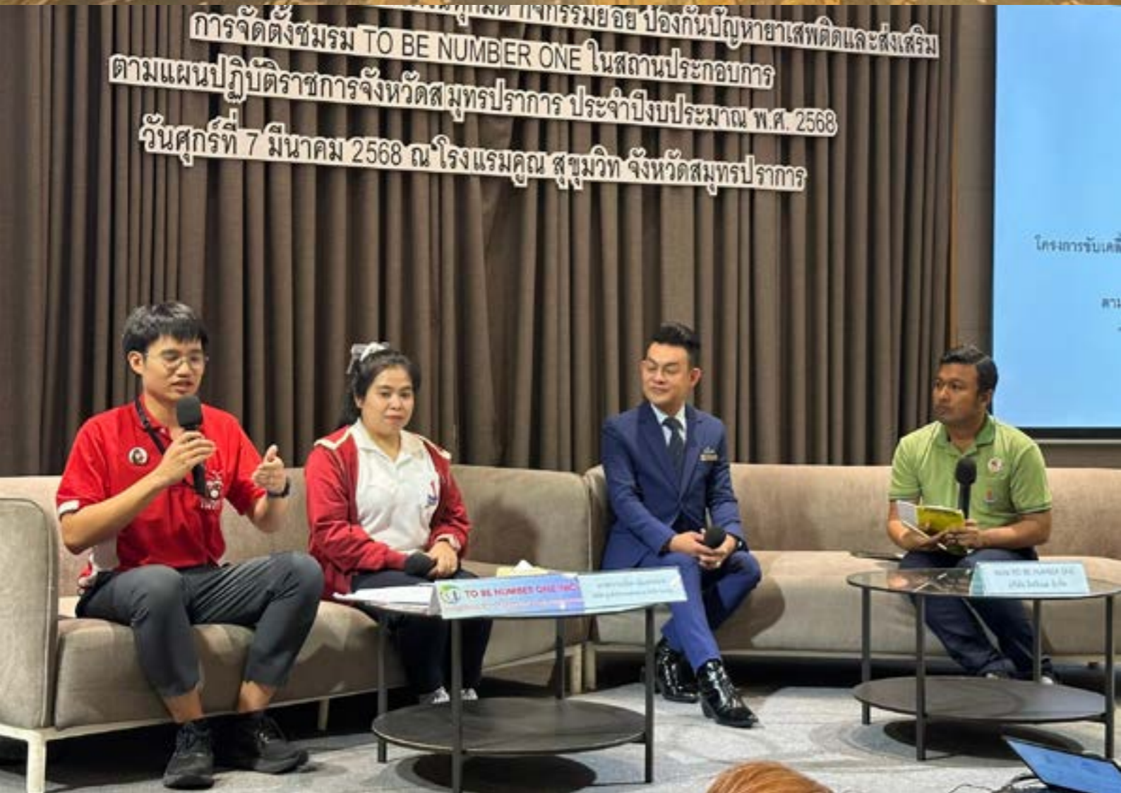
การจัดตั้งชมรม TO BE NUMBER ONE ในสถานประกอบการ ตามแผนปฏิบัติการราชการจังหวัดสมุทรปราการ ประจำปีงบประมาณ พ.ศ. 2568 วันศุกร์ที่ 7 มีนาคม 2568 ณ โรงแรมคุณ สุขุมวิท จังหวัดสมุทรปราการ