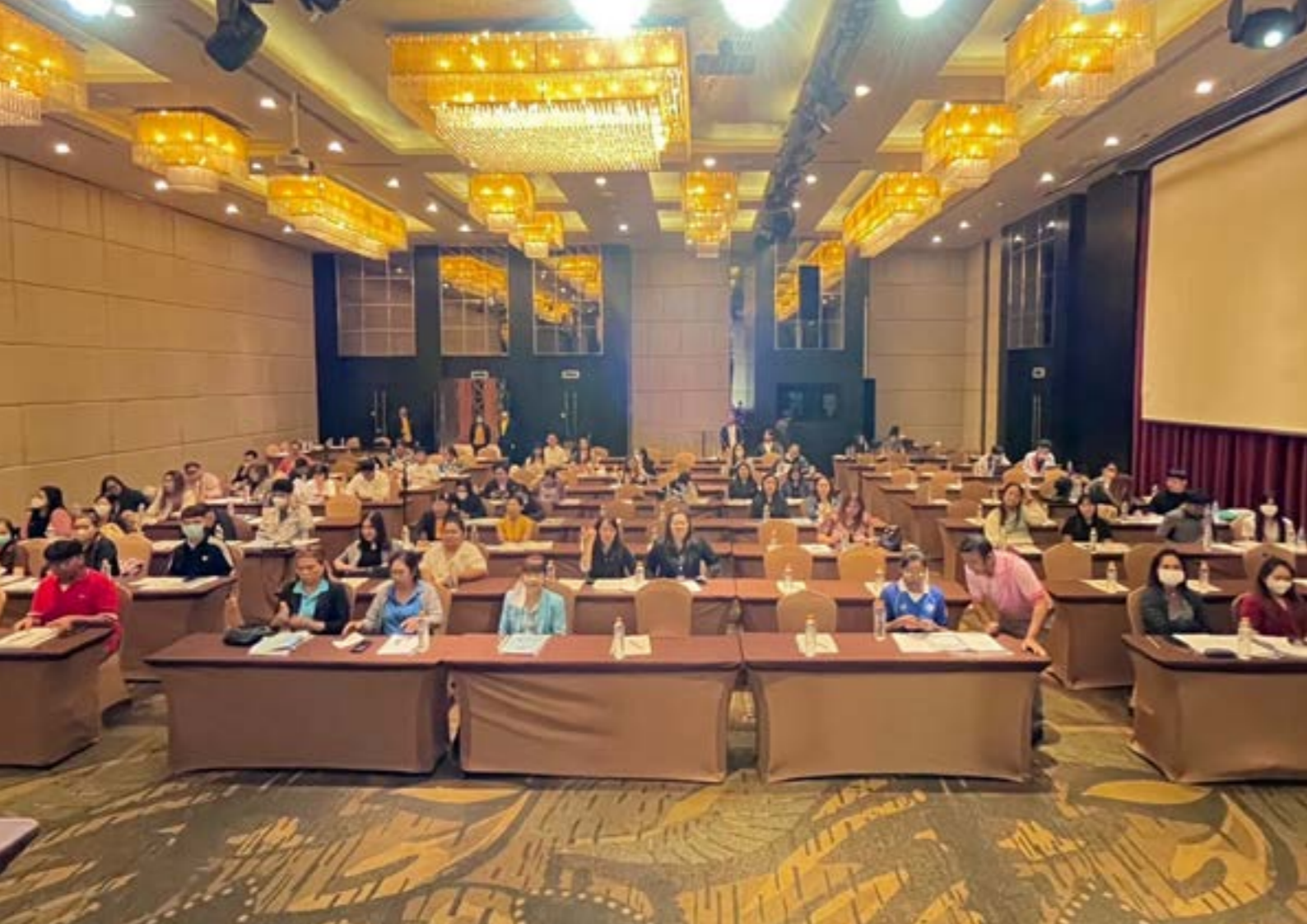
การจัดตั้งชมรม TO BE NUMBER ONE ในสถานประกอบการ ตามแผนปฏิบัติการราชการจังหวัดสมุทรปราการ ประจำปีงบประมาณ พ.ศ. 2568 วันศุกร์ที่ 7 มีนาคม 2568 ณ โรงแรมคุณ สุขุมวิท จังหวัดสมุทรปราการ