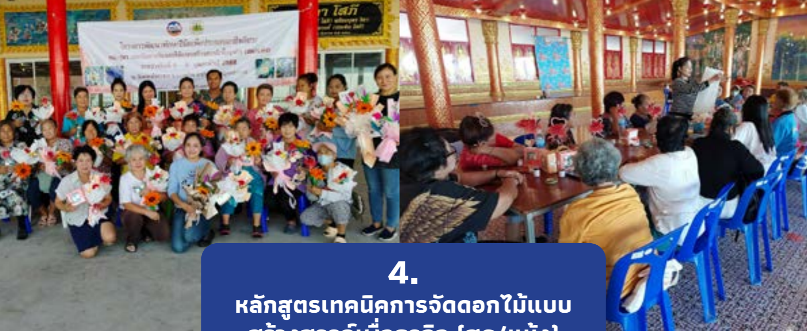
4. หลักสูตรเทคนิคการจัดดอกไม้แบบ สร้างสรรค์เพื่อธุรกิจ (สด/แห้ง) จำนวน 4 รุ่น