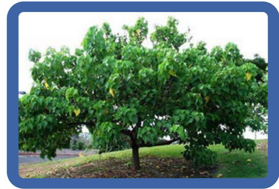
ต้นโพทะเล