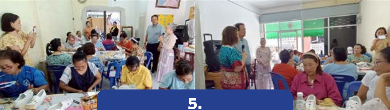
5. หลักสูตรศิลปะงานปัก จำนวน 3 รุ่น